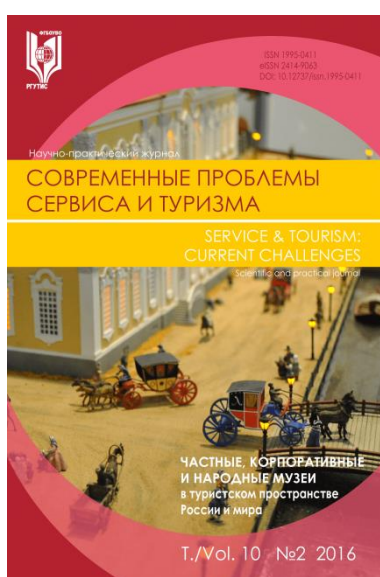
Современные проблемы сервиса и туризма

Важнейшее направление деятельности Издательства РГУТИС – выпуск периодических научных изданий – журналов, основателем которых является Университет. Кроме селевого научного журнала "Сервис в России и за рубежом" , также издаются журналы: